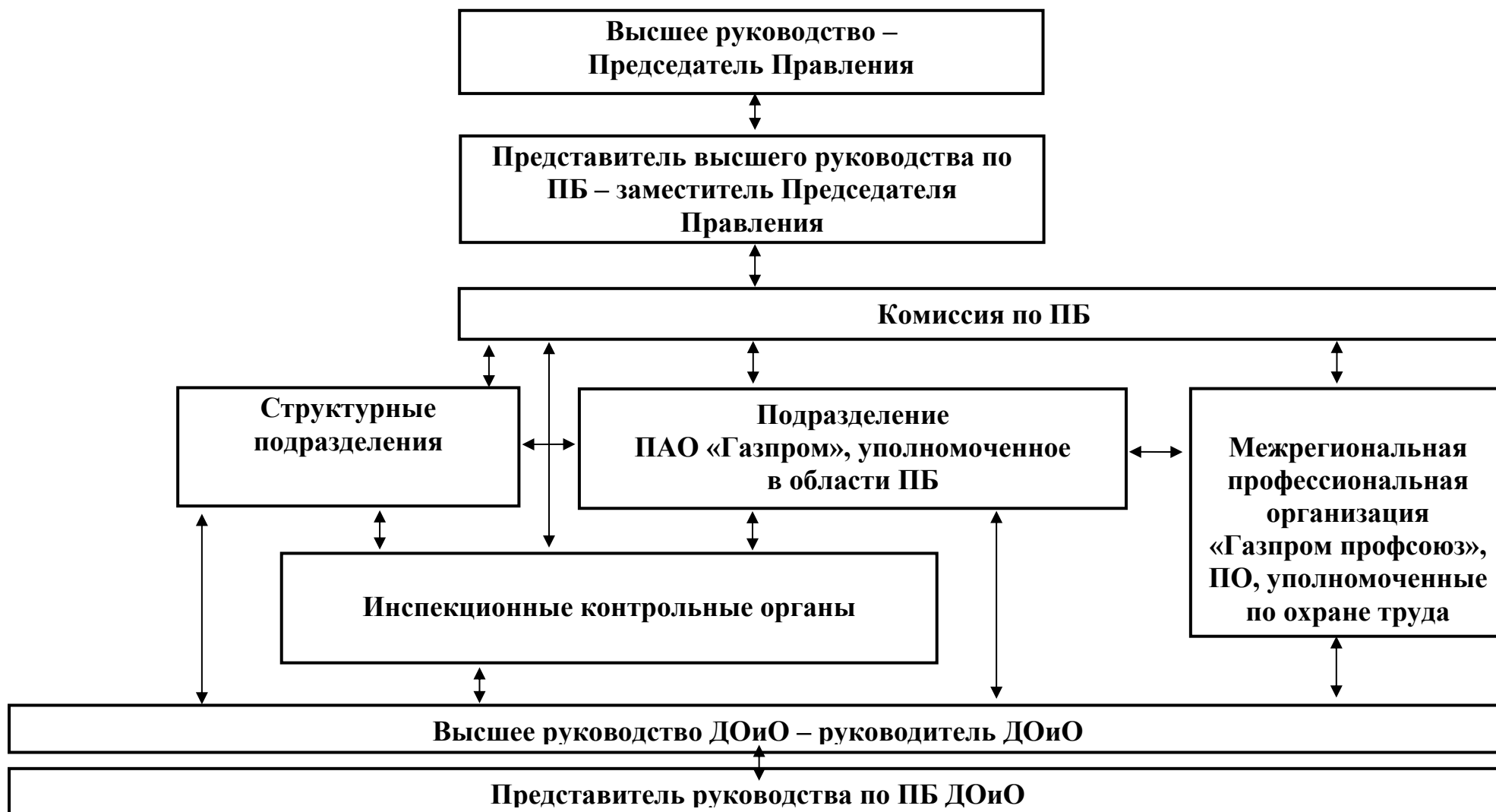
Схема структуры Единой системы управления производственной безопасностью в ПАО «Газпром»